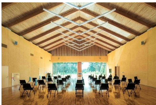
↑ゴルフ場が一望できるホール